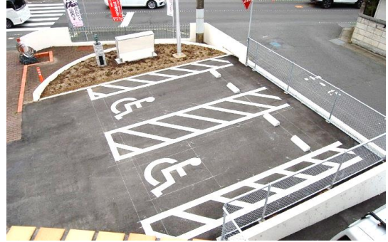
●障がい者用駐車場2台