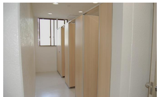
●体育館トイレ男女