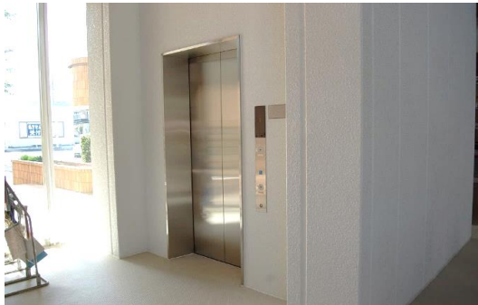
●エレベーター設置