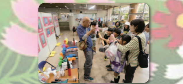
バルーンは こう折り曲げてね!