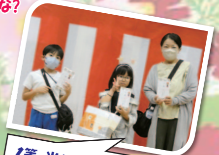
1等 当たっちゃいました!