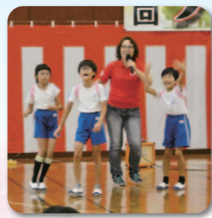
ザ☆サカナスターズと一緒に ジャンボリーミッキーダンス!