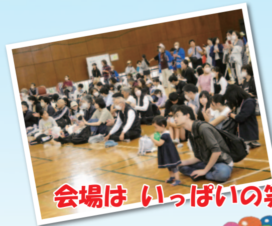
会場は いっぱいの笑顔があふれました!