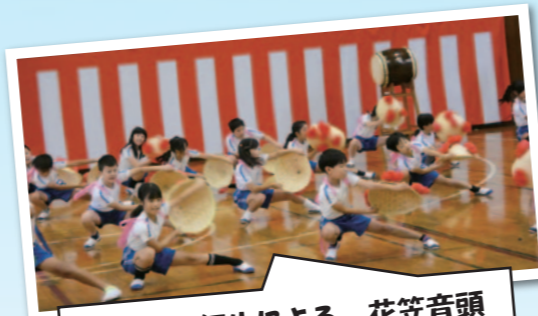
大沼小4年生による 花笠音頭