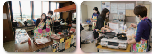
おそろいエフロンで! 揚げるのも大忙し