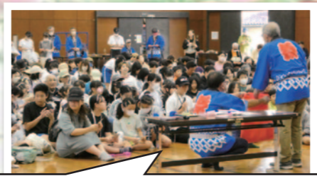
熱気いっぱいのビンゴゲームでした