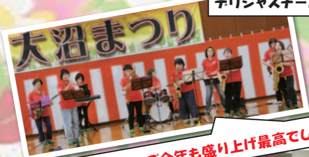
ザ☆サカナスターズ今年も盛り上げ最高でした!