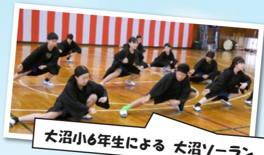
大沼小6年生による 大沼ソーラン