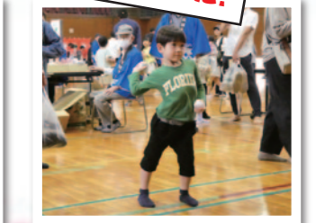
ちからいっぱい投げて!