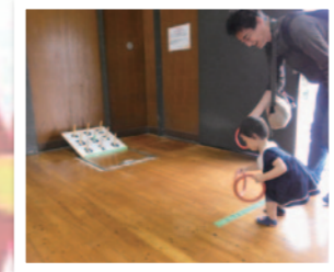
パパと一緒にわなげ