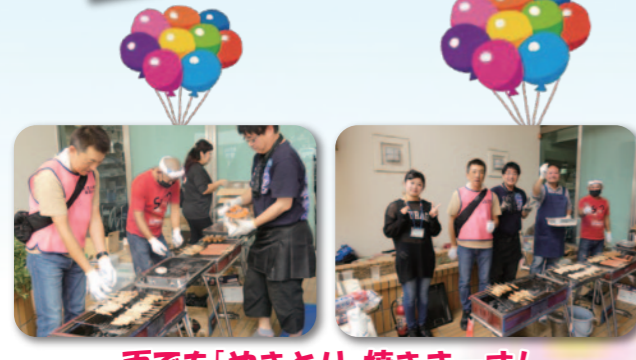
雨でも「やきとり」焼きまーす!