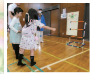
ラダーゲッター命中したかな?