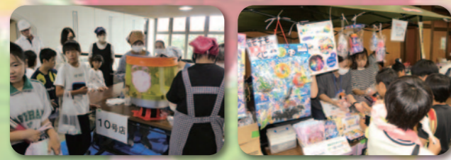
綿あめも、お店も行列でいっぱい!