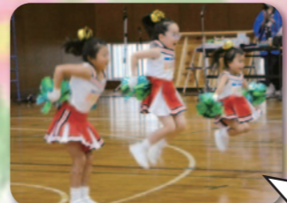
テリシャスチームの熱いダンスは圧巻でした!