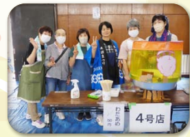
青少年育成部 (綿あめ)