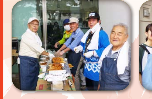
やきとりチーム “今年も” まいうー