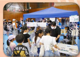
ボーイスカウト第6団 (お好み焼き・おもちゃ釣り・バザー等)