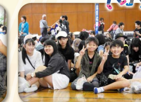
大盛り上がりのビンゴゲームでした