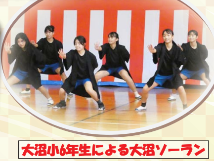
大沼小6年生による大沼ソーラン