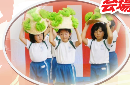
大沼小4年生による花笠音頭