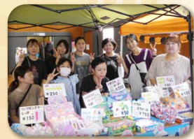
大沼小 PTA (駄菓子・おもちゃ・くじ 等)