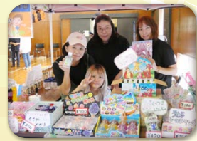
大沼サッカー少年団 (ラムネ・ジュース・駄菓子・くじ 等)