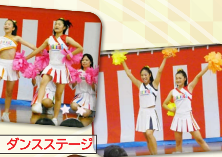
デリシャス ダンスステージ