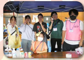
親慈の会 (光るおもちゃ・フランクフルト・肉巻ドッグ等)