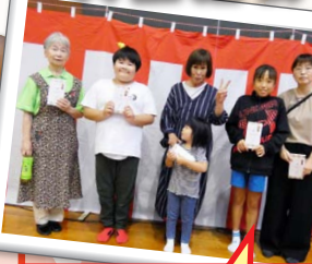
1等 当たっちゃいました