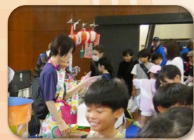
大沼サッカー2003 (からあげ)