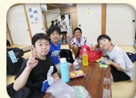
子どももおとなも、笑顔のハーモニー