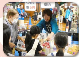
福祉部 (豆つかみ・お菓子・くじ等)